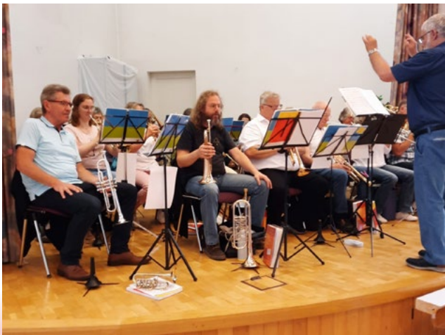
CVJM Posaunenchor Hilchenbach, der immer offen ist für Verstärkung.

Auch fand viel Begegnung statt, schon beim Ankommen vor Beginn des Gottesdienstes, in der Gottesdienstgemeinschaft, beim anschließenden Stühle stapeln und nicht zuletzt beim gemeinsamen Mittagessen, zu welchem die Christliche Gemeinde Gerbergasse alle nach dem Gottesdienst einlud. Wer noch mitkam, durfte ausgesprochen leckere Würste und Salate sowie die Gastfreundlichkeit der Gastgeber genießen.